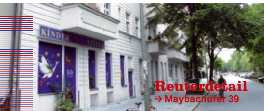
Reuterdetail → Maybachufer 39

→ dynamic yoga , montags–sonntags, morgens– abends, yogakurse, workshops, events, retreats || Infos T: 01578 727 69 91, www.yogawave.de