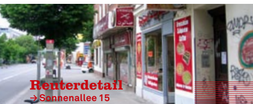
Reuterdetail → Sonnenallee 15

27.06.–22.07. → NIKODEMUS KIRCHE Ausstellung Seniorenplastik || Mo–Fr 10–18 Uhr