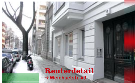
Reuterdetail → Weichselstr. 49

→ Read on, my dear – Lesebühne in Kooperation mit Spreeblick, mittwochs ab 20.30 Uhr, Eintritt kostenlos, Austritt mit Hut (Spende)