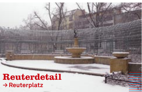
Reuterdetail → Reuterplatz