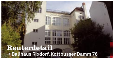
Reuterdetail → Ballhaus Rixdorf, Kottbusser Damm 76

ART-IN-MOVEMENT → Tanzlaboratorium mit Ricarda Schuh mittwochs 18–20 Uhr, Probestunde n. V. || Infos: T: 615 56 33, www.ricarda-schuh.de ATELIER SCHELLBACH → Glasperlen-Workshops und Filzkurse Termine auf Anfrage, T: 61 30 57 58 || Infos: www.fajalobi.de / www.uteschellbach.de GALERIE CLAUDIA MANGELSDORFF → Stricken für AnfängerInnen und Fortgeschrittene ab 05.11., donnerstags 19–21.30 Uhr || (12 € / Abend), Infos: T: 48 49 42 76, info@stoffekunst.de ORI → Projektmanagement für FotografInnen 14.11., 10–18 Uhr → Fundraising für FotografInnen und Fotografen 15.11., 10–18 Uhr → Fotografie in Kriegs- und Krisengebieten 21.11., 10–18 Uhr || Gebühr: je 100/130 €, Infos: T: 69 53 37 80, www.ori-berlin.de TANZART LABOR → Offene Klasse mit Anna Barth, Körperarbeit, Improvisation und Butoh, dienstags 20–22 Uhr || Infos: T: 69 50 60 74, www.annabarth.de