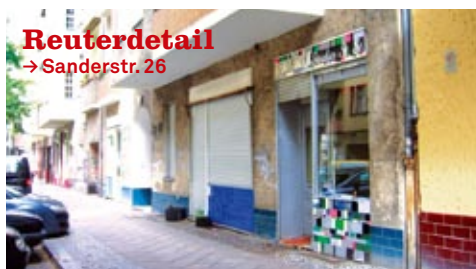
Reuterdetail → Sanderstr. 26