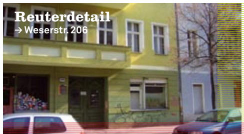
Reuterdetail → Weserstr. 206