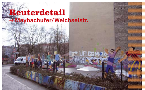
Reuterdetail → Maybachufer/Weichselstr.