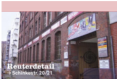
Reuterdetail → Schinkestr. 20/21